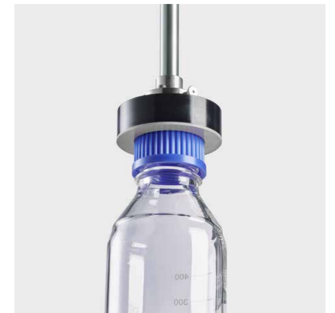
通用膜片适配器 - 用于平顶的瓶盖

根据瓶盖的特定形状，定制的瓶盖适配器可消除通常由夹紧或其他瓶盖固定装置引起的额外压力。另外，通用膜片适配器可用于具有平顶的瓶盖，从而最大限度地减少适配器的数量。