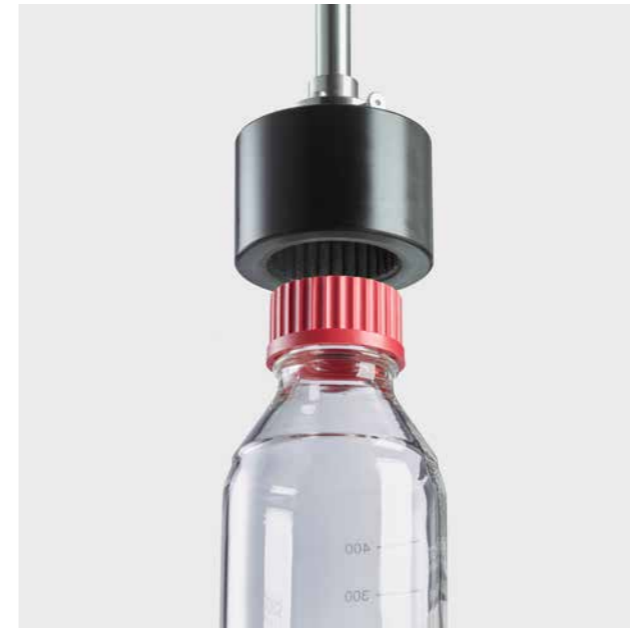
瓶盖适配器 - 根据不同的瓶盖形状量身定制

TM200 专为精确测量瓶盖的打开和关闭扭矩而设计。它的通用支架可容纳从小瓶到大水罐的所有物品。位于主机中的高精度称重传感器在整个测试过程中可连续测量力的大小。